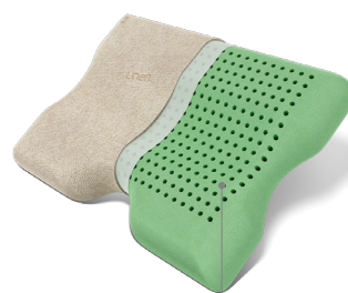
pianka VitaRest Origin™

Nowa generacja poduszki ViscoBio wykonana jest z wysokiej jakości pianki termoelastycznej nasączonej olejem rycynowym, aby zapewnić niezrównany komfort i relaks. Poduszka każdorazowo reaguje na ciepło ciała, a także punkty nacisku, pomagając kręgosłupowi i grupom mięśniowym okółokręgosłupowych utrzymać odpowiednią równowagę, aby dobrze odpocząć. Podtrzymuje głowę i szyję, zmniejszając nagromadzone, negatywny wpływ na nerwy obwodowe. To likwiduje zmęczenie, dyskomfort i umożliwia sprawną regenerację i odpoczynek podczas snu. Technologia otwartokomórkowa wspiera termoregulacyjne właściwości pianki, chroniąc nas przed przegrzaniem podczas snu.