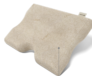
naturalny pokrowiec Linen